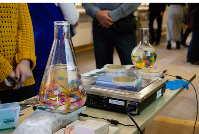
«YesLab» - научно-кулинарное студенческое объединение показало мастер-класс «Вкусная