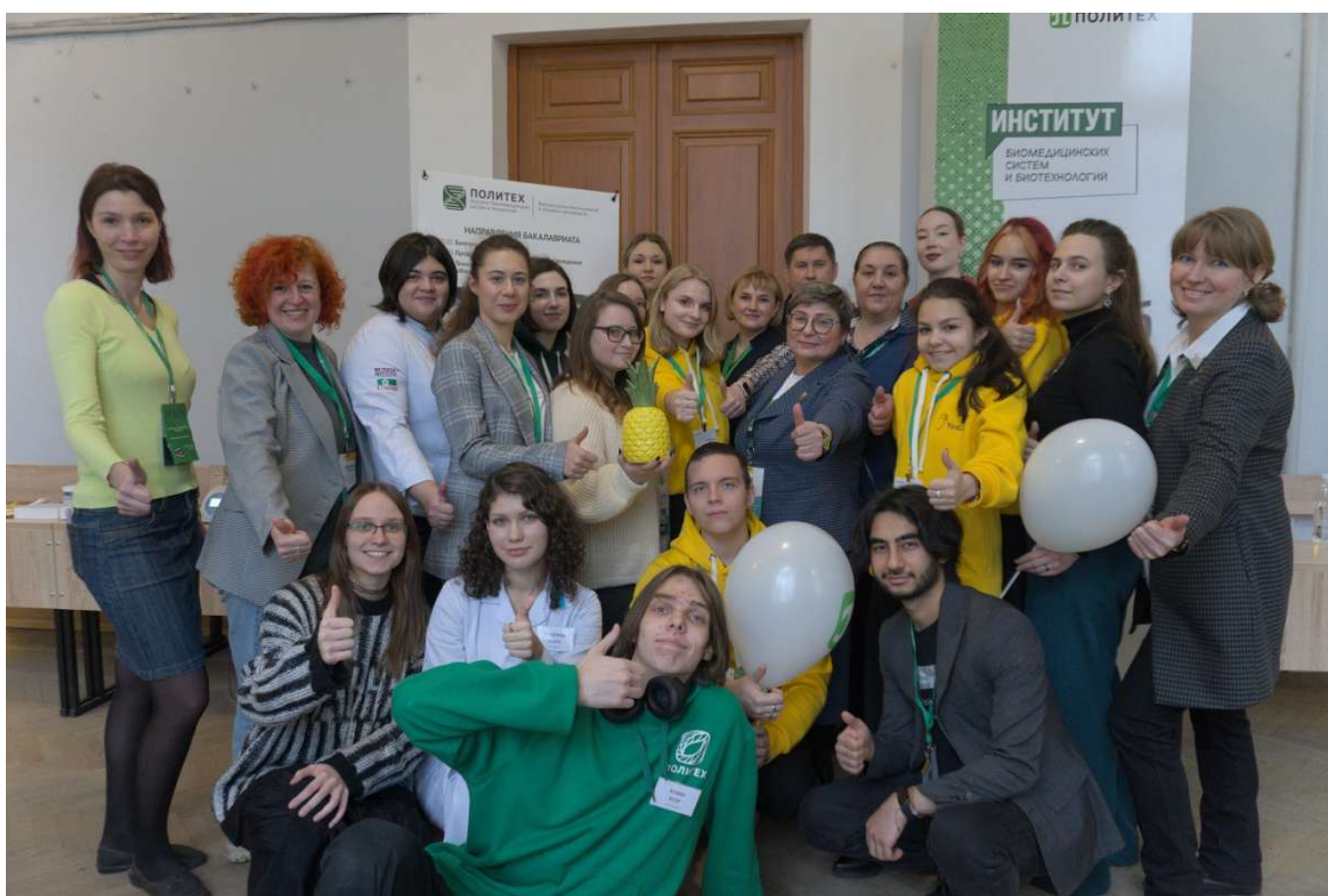
Представители Института биомедицинских систем и биотехнологий проконсультировали